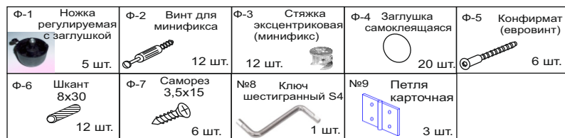
Таблица фурнитуры тумбы